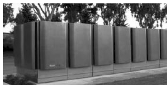
图 2 BE 公司 50 kW 的 SOFC 模块

BE 公司是行业内公认 SOFC 技术力量最强、运作最成功的公司。BE 公司 SOFC 采用电解质支撑电池技术,经过之前西屋公司多年的研发,该技术相对成熟,寿命和可靠性较好。BE 公司目前主打产品规格在 100~250 kW,标准模块是 50 kW(图 2),并在数据中心、楼宇等进行分布式商业应用,总规模达到 100 MW 级以上 [13] 。