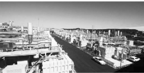
(b) 韩国 59 MW 天然气 MCFC 电站