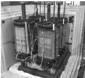
图 5 GEFC 50 kW 的 SOFC 模块 Fig. 5 GEFC 50 kW SOFC module