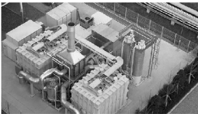
(a) 3 MW 级天然气 MCFC 发电系统